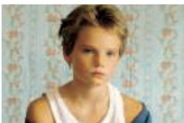
Un'immagine da "Tomboy"

prenderà parte la regista Céline Sciamma, 31 anni, al suo secondo film, dopo che il suo lungometraggio d'esordio ("Naissance des pieuvres", 2007) aveva vinto il Premio Delluc come miglior opera prima francese. L'argomento di "Tomboy", dice, "è un serbatoio di finzione davvero appassionante: crea una drammaturgia intorno alla menzogna, al doppio gioco, alla doppia vita, all'alterità, tutti motori di finzione molto forti". Il biglietto per la serata costa 6 euro e può essere acquistato presso le sale di Circuito Cinema Genova (Ariston, City, Corallo, Odeon, Sivori) o su www.happyticket.it . Per i tesserati Many Movies Gold o Young, 3€.