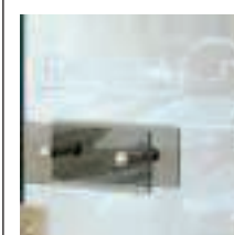
La galleria "Or" di piazza Marsala ospita la mostra "Stra-volti"